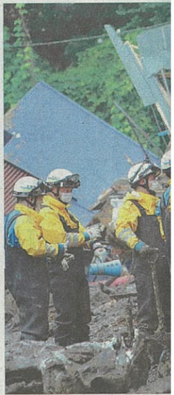
土石流に襲われ 探索する警察官

発表した。死亡した1人を 除き、99人を起訴猶予とし た。100人を被買収容疑 で告発した市民団体は不起 訴を不服として、検察審査 会に審査を申し立てる方 針。 地検の発表では、100 人は19年3〜8月、広島選 挙区に自民党公認候補とし